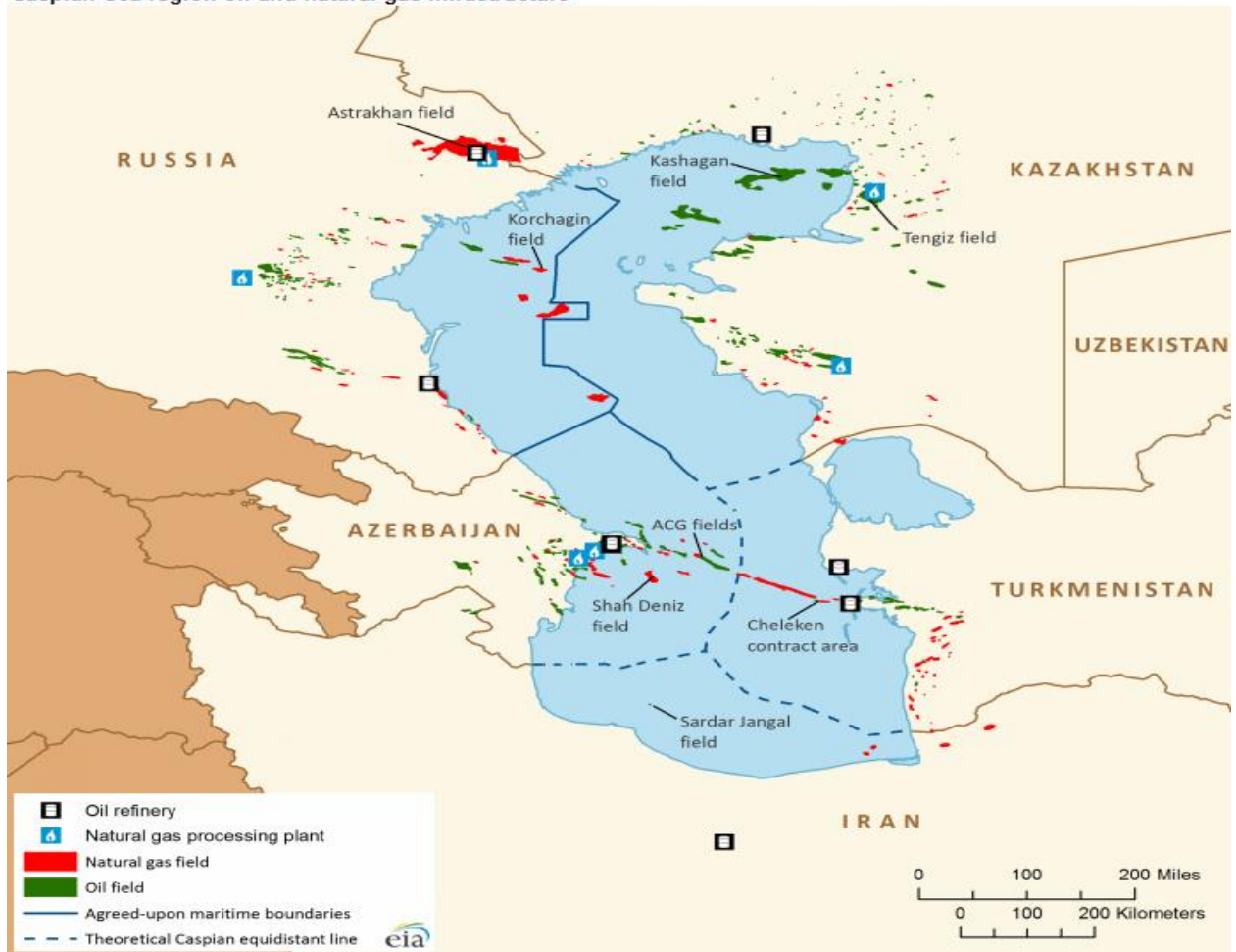
Сурет 1 - Каспий теңізі мұнай мен табиғи газ инфрақұрылымы